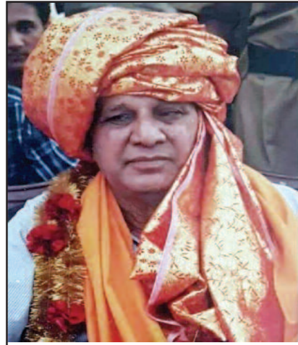
(March 15, 1934 – October 9, 2006)

brick)" and on the other cobbled up governments with the Congress Party, BJP and Samajwadi Party at his will and convenience. Babu Kanshi Ram was a master strategist and a visionary. In the run up to his ultimate goal to grab political power, he launched an outfit of dalit employees, backward and minority communities in 1978 called BAMCEF. He floated yet another organization of dalit and socially exploited communities in 1981 and named it DS4 and graduated to form a full fledged political party on April 14, 1984 (birth anniversary of Babasaheb Ambedkar) and named it Bahujan Samaj Party (BSP). M.J. Akbar, a known journalist and columnist, summed up the arrival of Babu Kanshi Ram and said, 'He has come but yet to reach.' He reached too during his life time and transformed the BSP to a ruling party in UP, the biggest state of India, under the stewardship of his protégé Mayawati not once but four times. BSP sent a good number of MPs to parliament and a number of state legislatures. BSP became one of the several national parties under the