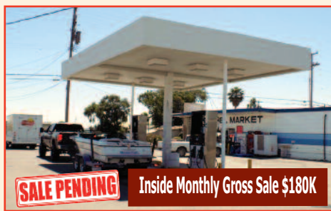
Gas Station, Liquor Store, Deli, & Laundromat! In Contra Costa County, CA Listing Price: $1,200,000