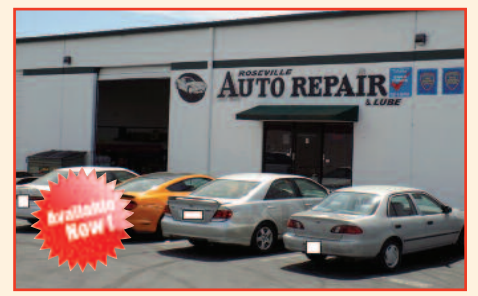
Auto Repair & Lube Shop Lot Size: 2000, Rent is ONLY $1500/mo. Listing Price to $149,000 Sacramento, CA