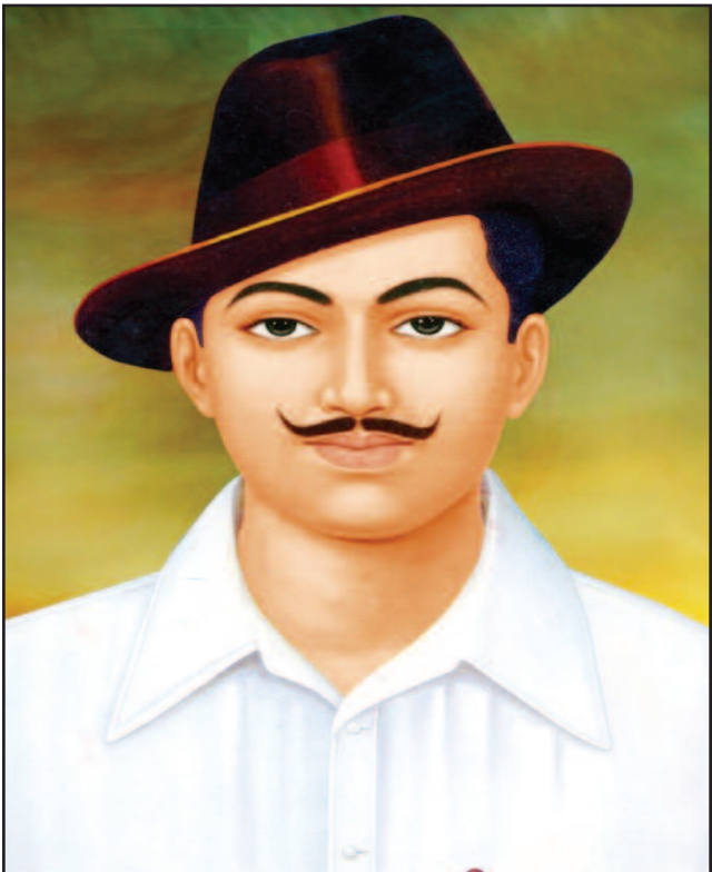
ਦੇਸ਼ ਦੇ ਨੌਜਵਾਨਾਂ ਲਈ ਇੱਕ ਵੱਡਾ ਆਦਰਸ਼ ਹਨ ਸ਼ਹੀਦ ਭਗਤ ਸਿੰਘ (ਸ਼ਹੀਦੀ-ਦਿਵਸ 'ਤੇ ਵਿਸ਼ੇਸ਼ ਲੇਖ ਦੇਖੋ ਸਫ਼ਾ 11, 12, 13 'ਤੇ)

ਮੁੱਖ ਸੰਪਾਦਕ : ਪ੍ਰੋਮ ਕੁਮਾਰ ਚੰਬਰ ਸੰਪਾਦਕ : 916-947-8920 ਫੈਕਸ : 916-238-1393 E-mail : deshdoaba@yahoo.com ਸੰਪਾਦਕ : ਤਰਸੇਮ ਜਲੰਧਰੀ