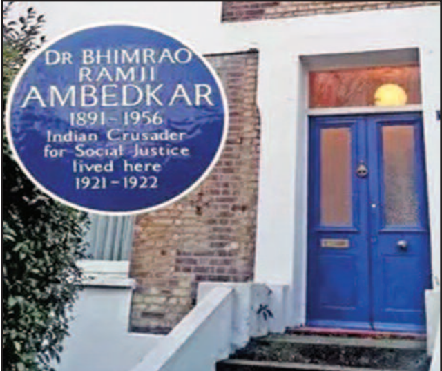
ਲੰਡਨ 'ਚ ਅੰਬੇਦਕਰ ਮਿਊਜ਼ੀਅਮ (ਦੇਖੋ ਸਫ਼ਾ 6)