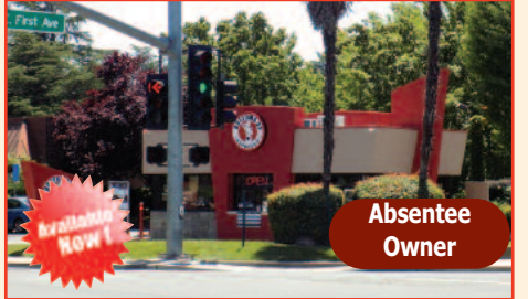
Coffee Shop for Sale Monthly Gross Sales: $25,000 Listing Price: $150,000