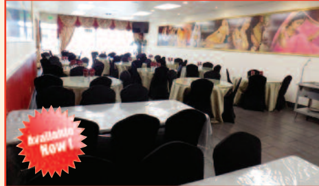
Indian Restaurant for Sale in Sacramento Listing Price: $149,000